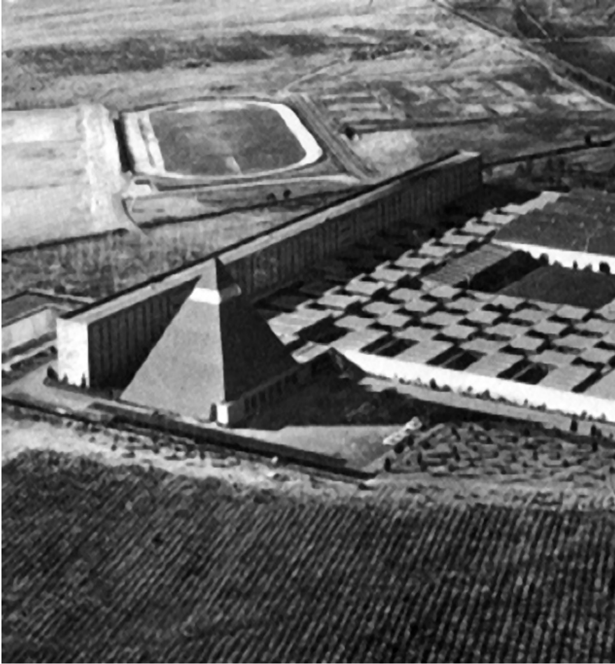
Universidad Laboral de Huesca