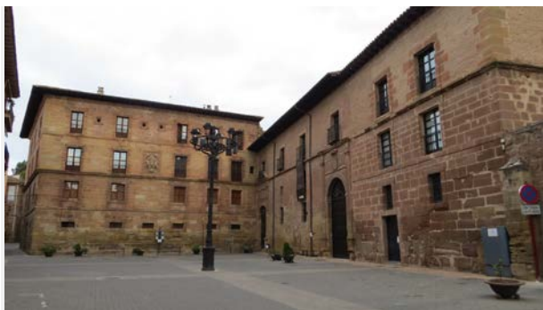
Escuela del Patrimonio Histórico de Nájera- La Rioja.

La inexplicable falta de un trabajo que estudiase las Universidades Laborales como conjunto de arquitecturas, hace que sean poco conocidas por las nuevas generaciones, un vacío inexplicable en la Historia de la Arquitectura Española Contemporánea. Este desconocimiento fue uno de los motivos por los que en Mayo de 2015, tuvo lugar en la Escuela de Patrimonio Histórico de Nájera, La Rioja. bajo la dirección de la Universidad Politécnica de Madrid, un curso, al que asistieron arquitectos, arqueólogos, profesionales de la conservación-restauración de bienes culturales, técnicos de museos, historiadores del arte, gestores de patrimonio..., dedicado a las Universidades Laborales realizadas en España a partir de los años cincuenta, hasta los setenta, por magníficos arquitectos y que constituyen una aportación interesante por sus valores arquitectónicos y urbanísticos y que, en la actualidad, están, en general, casi abandonadas o con usos menores, y en grave peligro de transformaciones inadecuadas que pueden alterar sus valores arquitectónicos y urbanísticos. No es el caso de la Universidad Laboral de Córdoba, espejo donde se mira el CAMPUS UNIVERSITARIO RABANALES