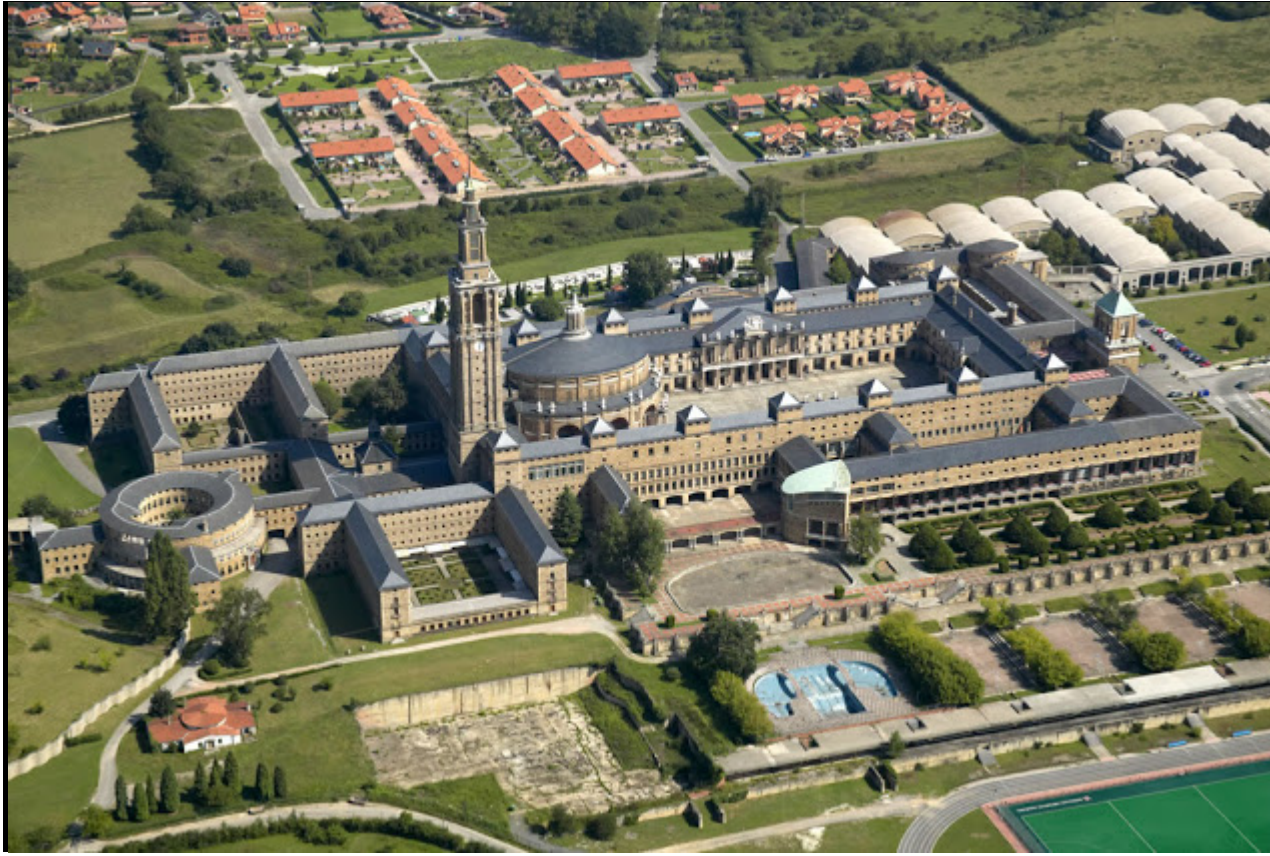
Universidad Laboral de Gijón