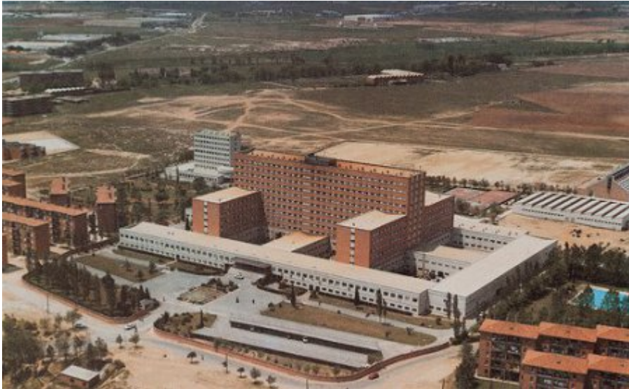
Universidad Laboral de Alcalá de Henares( Madrid)