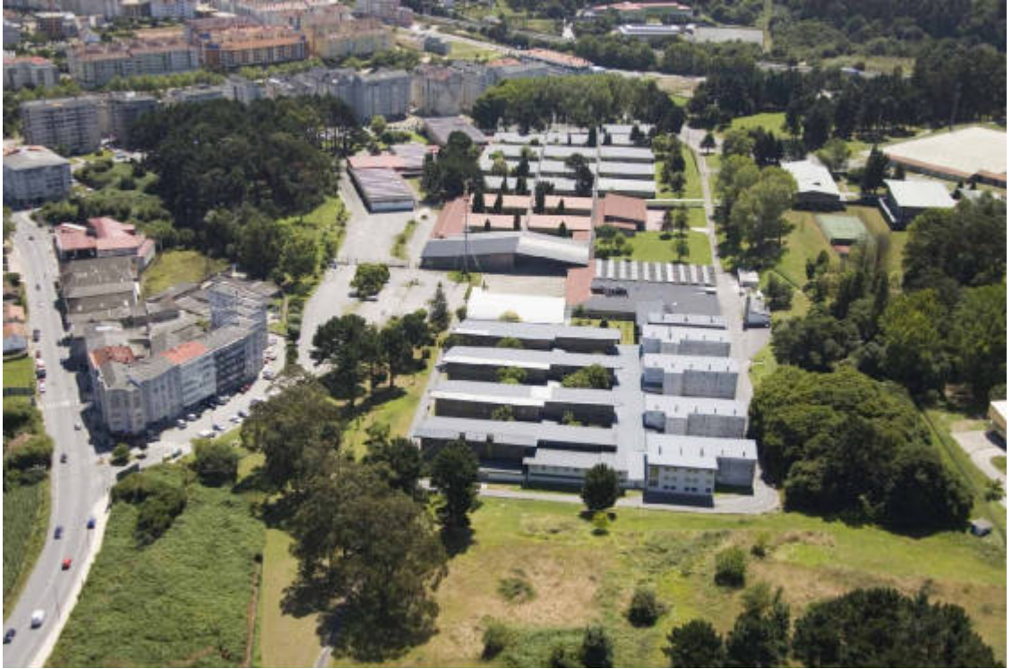
Universidad Laboral de A CORUÑA