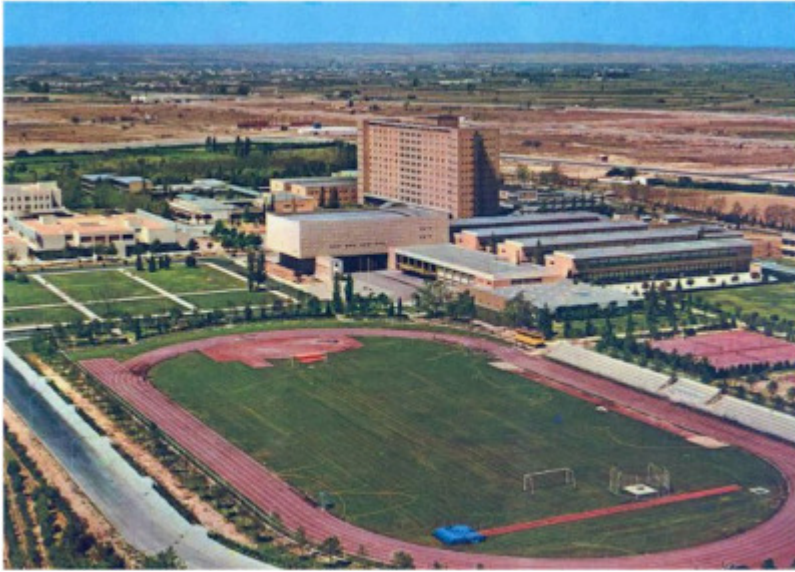
Universidad Laboral femenina de Zaragoza