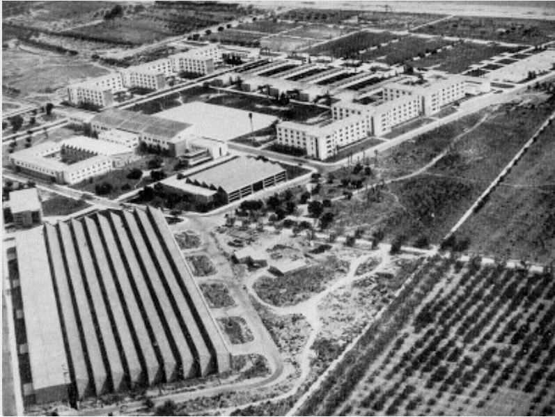
Universidad Laboral de Tarragona