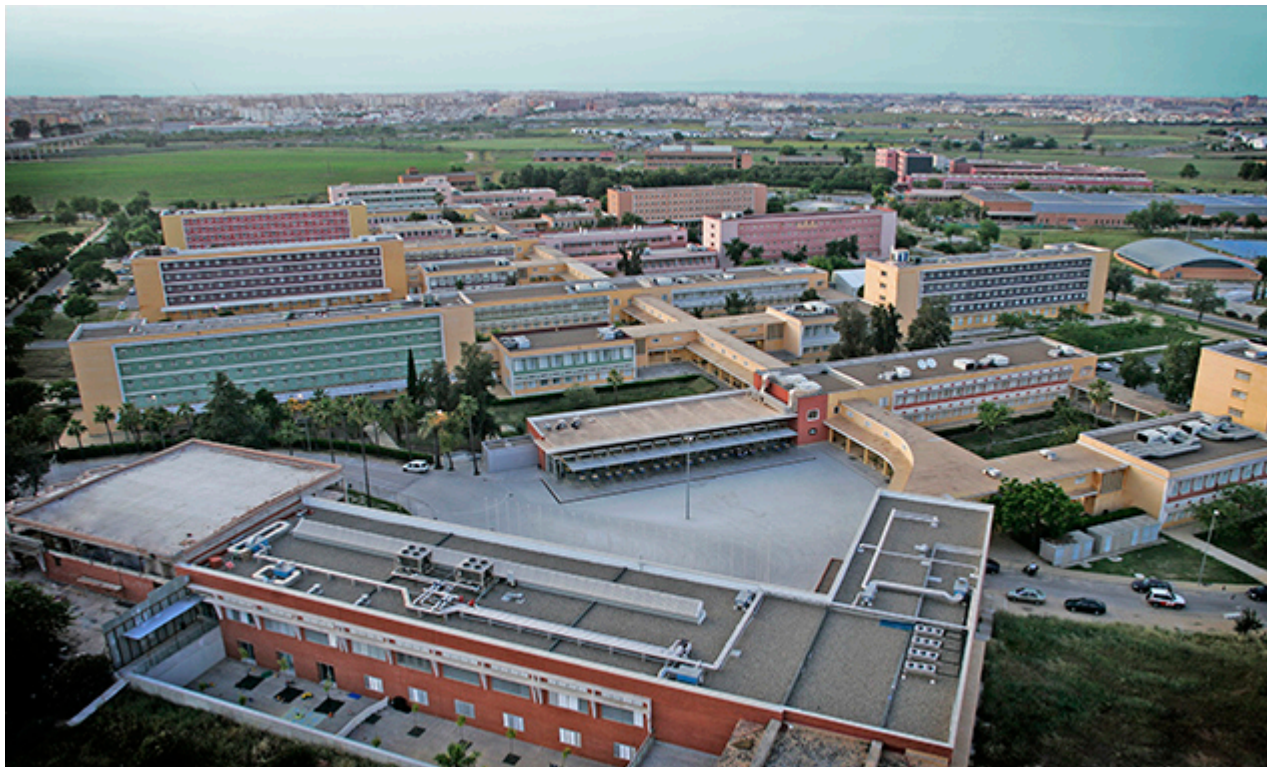
Universidad Laboral de Sevilla