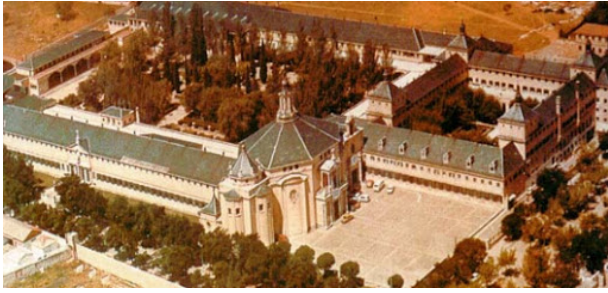
Universidad Laboral de Zamora