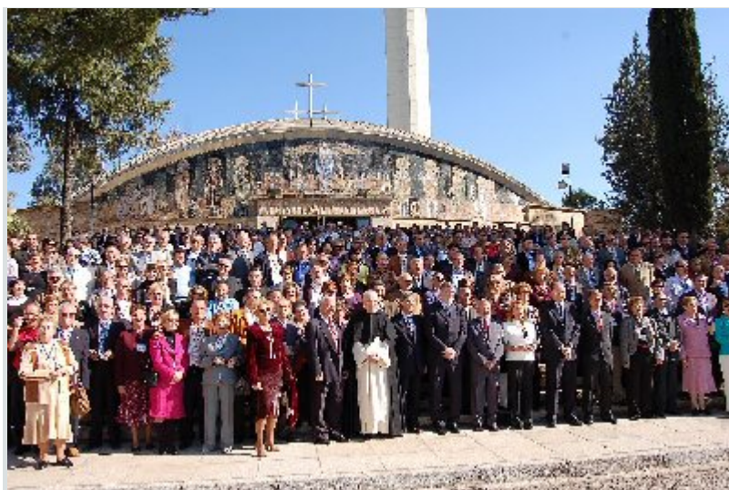
Ex alumnos y docentes, recuerdan su estancia en la Universidad Laboral de Córdoba (2007)

Por parte de la comisión organizadora de la efeméride se puso de relieve que la Universidad Laboral de Córdoba fue una institución educativa que tuvo, durante 23 años, una doble proyección: hacia dentro, impulsando instrumentos, actitudes y aptitudes dirigidas a una juventud exigente, deseosa de formación y conocimientos; y hacia fuera, proyectándose en los ambientes culturales de la ciudad; fomentando iniciativas cuyos beneficiarios fueron la industria y agricultura cordobesa, sin olvidar los anhelos de creación de centros de estudios superiores como anticipo de lo que sería la Universidad de Córdoba. A partir de 1990, de manera progresiva, se vivió la iniciativa de conservar la infraestructura básica de la antigua Universidad Laboral dándole un nuevo destino: el Campus Universitario Rabanales