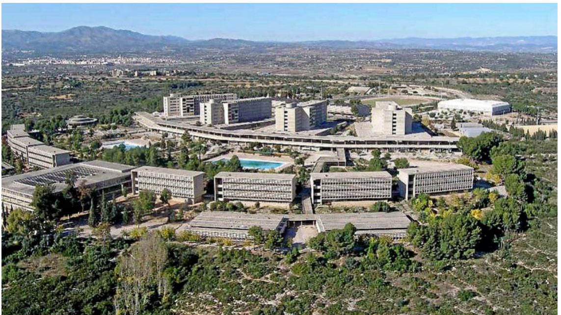
Centro de Universidades Laborales de Cheste (Valencia)